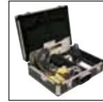
受限空间工具套装