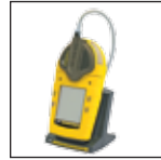
连体泵和电池充电器